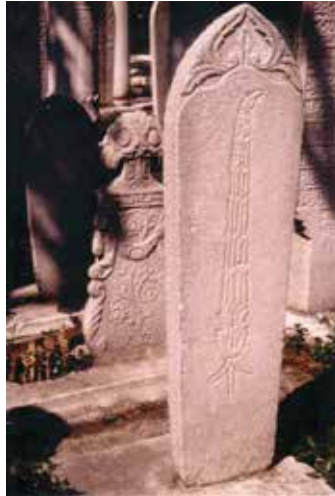
Şekil 1. Servi ağacı, Eyüp Mezarlığı ( http://osmanliistanbulu.org/tr/images/osmanliistanbulu-1/24_jean-louis-bacque-grammont.pdf , Erişim: 10.12.2018).

Osmanlı mezarlıklarındaki birçok mezar taşının üzerinde üsluplaştırılmış servi (Servi ya da Selvi; Cupressus ) motifini görmek mümkündür. Aşağıda Eyüp Mezarlığı'nda bir Osmanlı ayak mezar taşının üzerindeki servi görülmektedir ( Şekil 1 ).