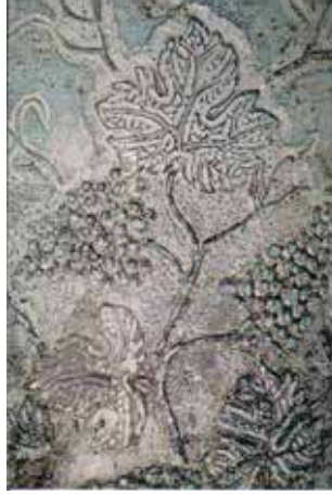
Şekil 2. Dayı Mehmed Paşa için dökülmüş olan Osmanlı Cezayir Eyaletine ait bir topun üzerindeki asma yaprakları ve üzüm salkımları motifleri. ( http://osmanliistanbulu.org/tr/images/osmanliistanbulu-1/24_jean-louis-bacque_grammont.pdf , Erişim:10.12.2018).

İstanbul’daki Askeri Müze’de korunmuş olan ve 18. yüzyıla ait topların üzerinde çam kozalakları, kıvrımlı dal bezemeler, damalılar ve kafesler, gül biçiminde motifler Osmanlı süsleme geleneğinden güzel örneklerdir. Bu motifler tekstil ürünlerinde de çeşitli şekillerde stilize edilerek kullanılmıştır.