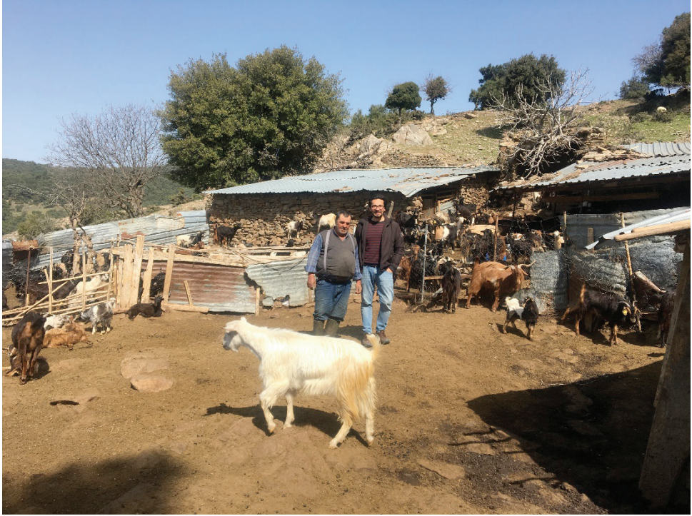
Fotoğraf 13: Yamanlar Köyü’ndeki ağıldan bir görünüm

Arazi mülkiyetinin el değiştirmesi yerel haklın yüzyıllar içerisinde uyarlandığı ve sürdürmekte olduğu yaylak tipi hayvancılığı devam ettirmelerini zorlaştırmıştır. Ekin yetiştirilen alanların özel mülkiyete tabi olması ve meralık alanların küçülmesi hayvancılık ile uğraşanları ticari yemlere bağımlı kılmıştır. Kentlerin kırsal alana ve kırsal yerleşimlere doğru saçaklanarak genişlemesi, kırsal yerleşimlerin çözümlen[ç]meyen sorunlarının üzerine kent- sel baskıların da eklenmesi, yasal-yönetmelikler ile kırsal yerleşimlerin kent statüsüne geçmesi sorunları daha da artırmaktadır (Çilingir ve Görgün, 2018, s.140). Conrad P. Kottak (2010), küreselleşmenin ekonomik ve politik aktörlerinin ekoloji üzerindeki kontrol arzularının, yerel toplulukların yaşadığı bölgelerdeki doğal kaynaklar üzerindeki hak taleplerini baskı ve zor yoluyla engellediğine dikkat çekmektedir. Buna göre, küresel kapitalist ekonominin aşırı kâr hırsıyla doğal bir yıkıma sebep olmanın yanı sıra kırsal toplulukların geliştirmiş oldukları uyarlanma stratejilerini (yaylak tipi hayvancılık) olumsuz yönde etkilemektedir (s.25). “Biz eskiden Yörük idik” ifadesi, yaylalara çıkıp çadır kuran Yörüklerin yerleşik yaşama geçerek tarımla uğraşmalarına, başka bir deyişle Yörüklerin iktisadi yapılarının değişimine işaret etmektedir (Aydın, 2020, s.1161-1162). Yamanlar Yörükleri de zamanla yaylacılıktan vazgeçerek kendi bahçelerinde sebze yetiştirmeye başlamışlardır.