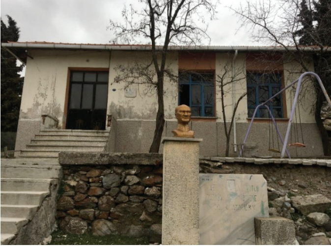
Fotoğraf 10 Yamanlar Köyü'ndeki ilkokul

Köyde taşmalı sisteme geçilmesinden ötürü atıl durumda olan bir ilkokul binası mevcuttur.