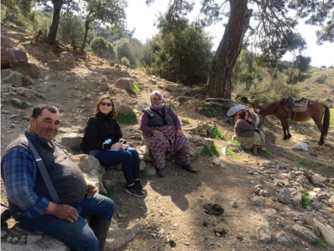
Fotoğraf 5 Köyde yaşayan bir aile ile yapılan görüşmelerden bir görünüm

Köye yerleşimin üç kanaldan olduğu anlaşılmaktadır. Birincisi; veba salgını 14 üzerine hâlihazırdaki mevkiye yakın Cocular Tepesi'ndeki Manastıryayla'dan 15 gelen Yörük nüfus, ikincisi Konya civarından bölgeye göçen Yörük nüfus, üçüncüsü ise köyde üç nesildir ikamet eden üç haneden oluşan Yunan işgali üzerine Arnavutluk'tan gelen Arnavut asıllı Müslüman Türk nüfus. Köyü çevreleyen tepelerde Ovacık, Çamurlu, Yukarıdağ (Ev), Çalibey, Göldağı, Buğdayalan yaylaları bulunmaktadır. 1913 yılında I. Dünya Savaşı ve öncesinde İzmir'in pek çok kaza ve nahiyesinde görülen çekirge istilasının yaşandığı köylerden biri olduğu da kayıtlara geçmiştir (Gökmen, 2010, s.129).